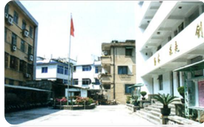
温州业余科技大学 (1985.1)