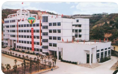
温州机械工业学校 (1965.8)