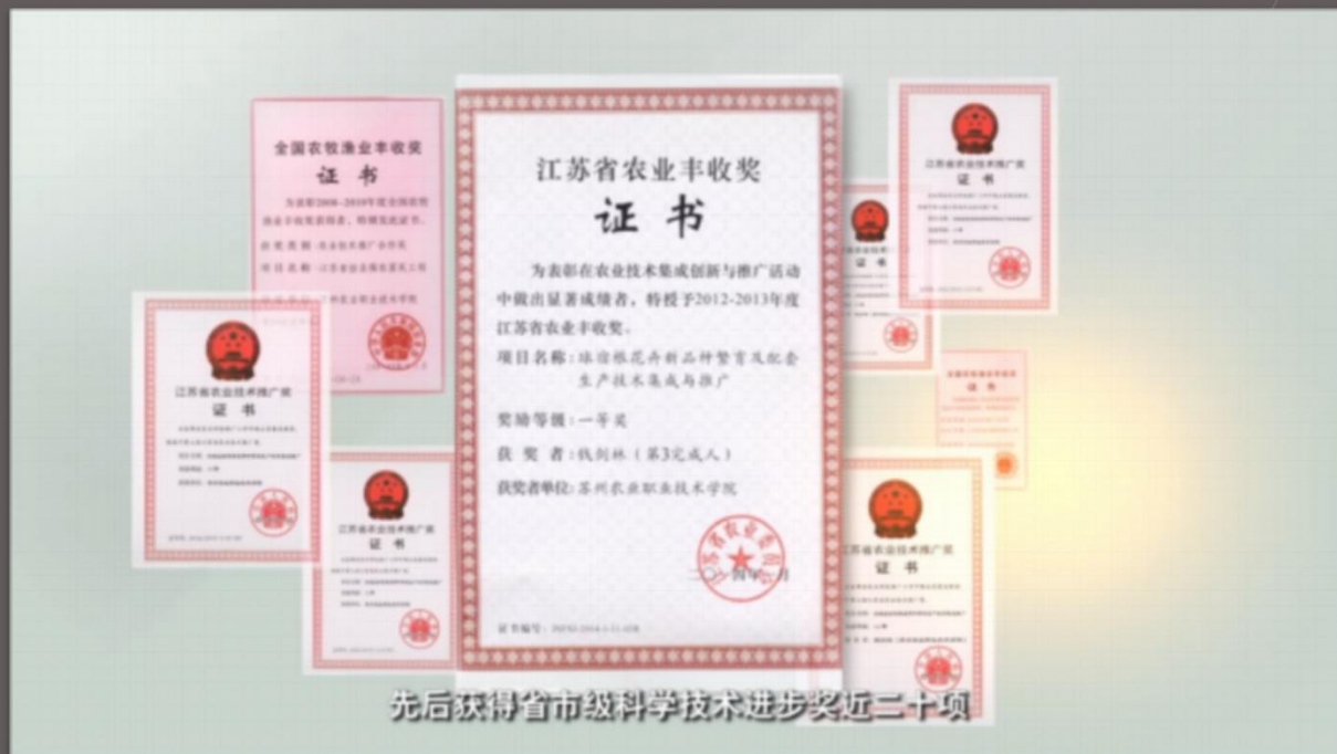
先后获得省市级科学技术进步奖近二十项

先后获得省市级科学技术进步奖近二十项， 以卓越的科研成绩和成果转化的应用赢得了良好的社会声誉