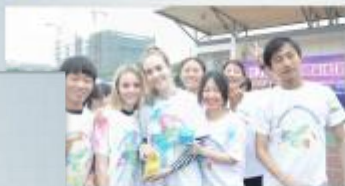
苏农以自身专业特色立足国际