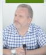
邀请各国专家、教授来校讲学、教学

广泛开展中外合作办学，定期选派优秀师生出国研修学习，邀请各国专家、教授来校讲学、教学，接受外国留学生来校实习，与8个国家18所高等学校缔结为友好学校