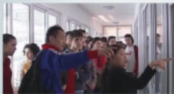
苏农以自身专业特色立足国际