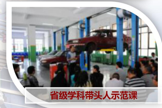
省级学科带头人示范课