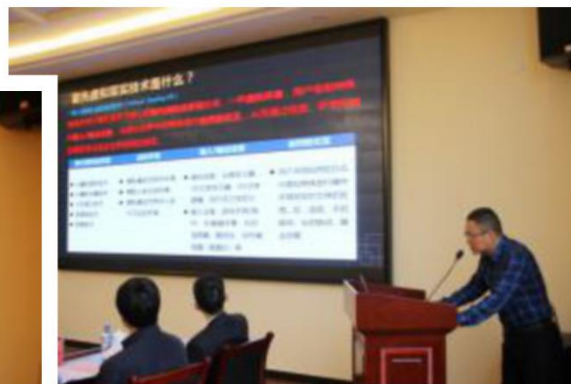
与开发区签订新能源汽车联合培养协议