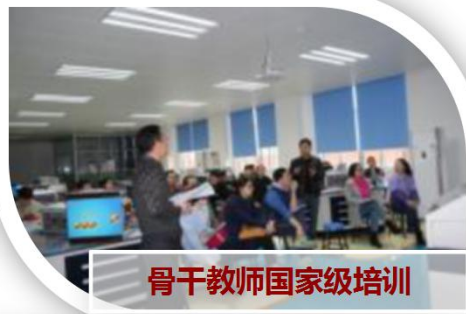
骨干教师国家级培训