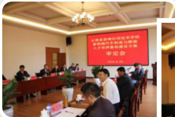
新能源汽车制造与维修人才培养审定会