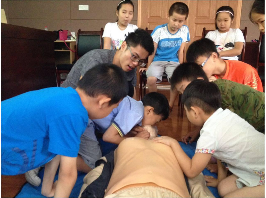
春泥·我把微笑带给你——关爱农村留守儿童计划