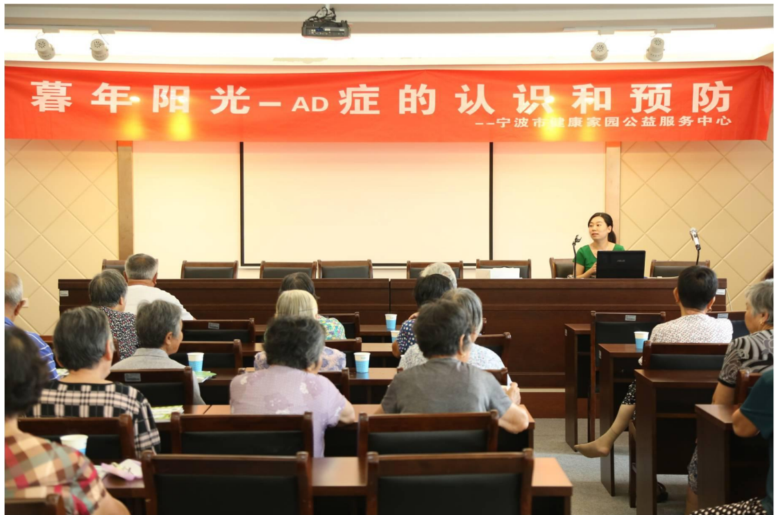
暮年阳光--AD 症认知及 AD 老人照护人员能力提升项目