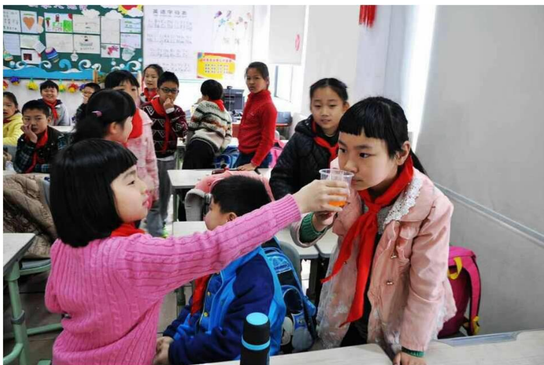
舌尖上的安全--食品安全科普教育项目