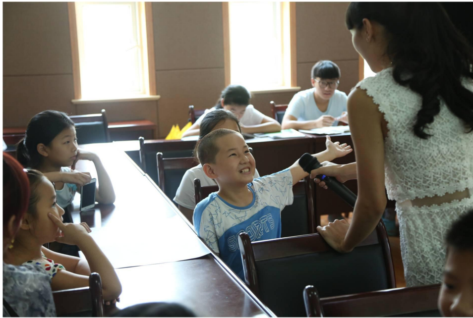
守护花季的Ta--青少年防性侵教育推广项目