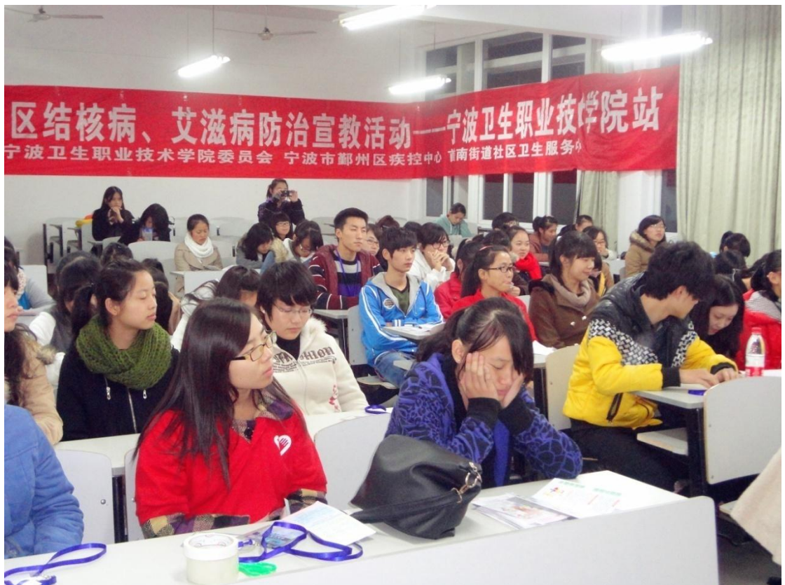
“结核病、艾滋病”宣教活动项目