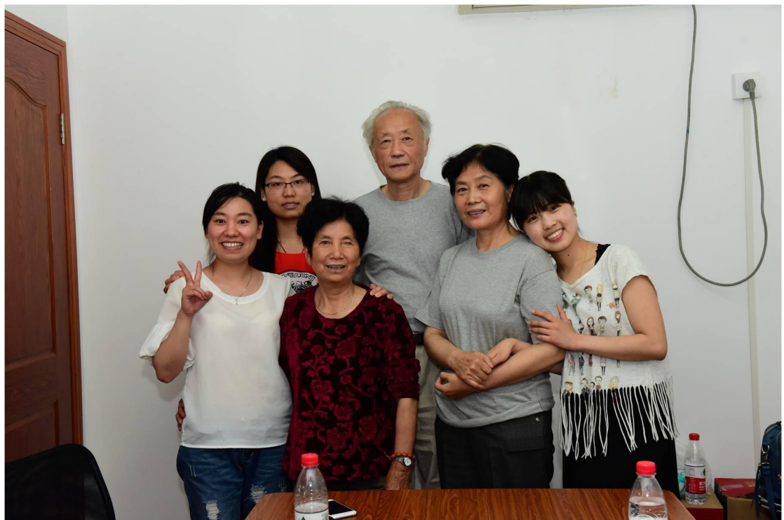
彼岸天使--临终文化促进项目