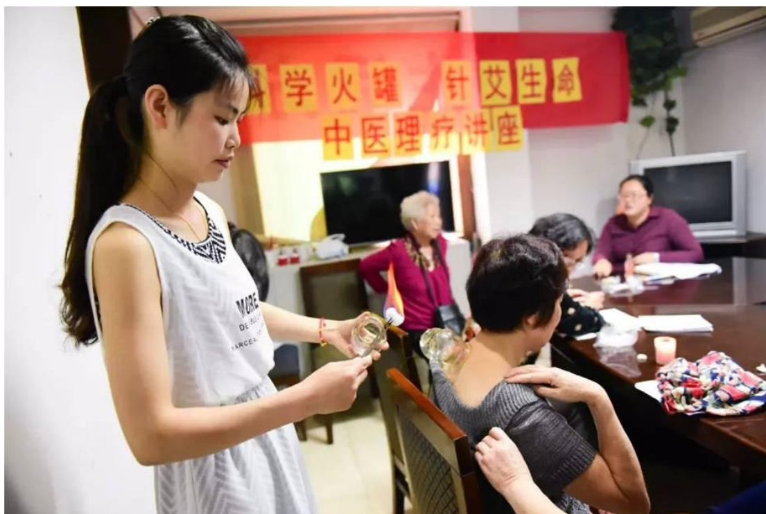
益起来--交互式社区健康沙龙